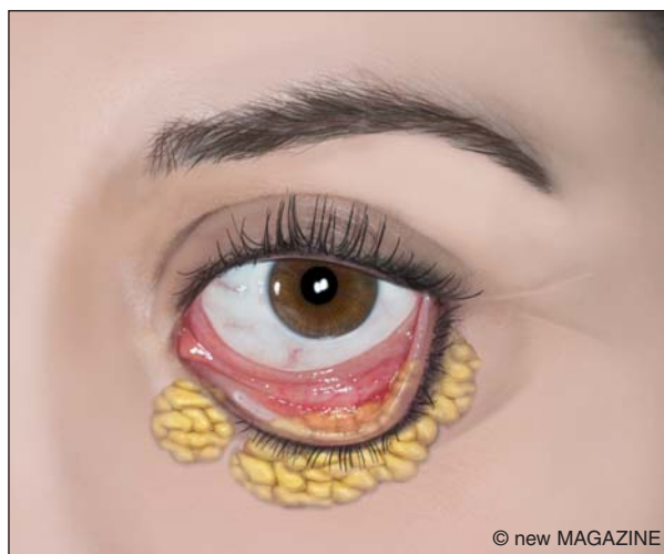
Figura 12. Blefaroplastica inferiore mediante accesso transcongiuntivale.

piccola striscia di muscolo orbicolare e la riduzione delle borse adipose. Dopo un'attenta emostasi si procede alla sutura con punti sottili e alla medicazione. L'intervento alla palpebra inferiore può essere condotto per via esterna o attraverso un'incisione transcongiuntivale. Nel primo caso (blefaroplastica per via esterna) è condotto attraverso un'incisione che decorre pochi millimetri sotto la linea delle ciglia e si prolunga di poco lateralmente all'angolo esterno dell'occhio. Le borse adipose, secondo le tecniche, possono essere ridotte (asportate) o riposizionate per correggere eventuali difetti a livello del solco lacrimale (occhiaie). Si procede quindi alla rimozione della cute, se in eccesso, all'emostasi e alla sutura. Nel secondo caso (blefaroplastica transcongiuntivale), l'incisione è eseguita solo attraverso la congiuntiva (faccia interna della palpebra inferiore). L'eventuale eccesso cutaneo è corretto con incisione cutanea subciliare o con tecniche alternative (laser assistite o peeling chimici).