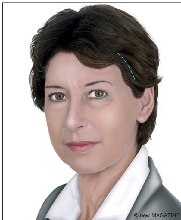
Figura 3. Lifting temporale: approccio temporale.