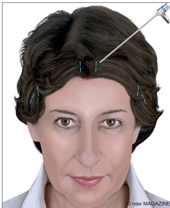
Figura 4. Lifting frontale e temporale endoscopico.

standardizzabile, bensì è personalizzata sulla base delle caratteristiche individuali.