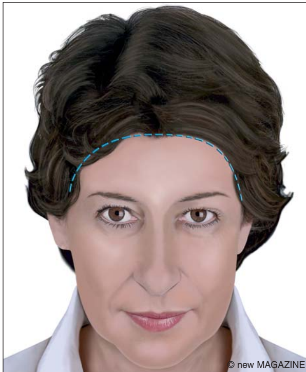
Figura 1. Lifting frontale: approccio precapillizio.

La stabilizzazione nella nuova posizione è ottenuta mediante sutura diretta, oppure ancoraggio e fissazione dei tessuti alle strutture profonde (scheletro, periostio, fasce muscolari), mediante speciali fili di sospensione o specifici dispositivi, alcuni dei quali possono essere permanenti e/o richiedere l'esecuzione di fori nell'osso. La sutura cutanea è eseguita senza tensione. Come spesso avviene in Chirurgia Plastica, si tratta di un intervento complesso e non di uniformità routinaria, nel senso che la procedura non è completamente